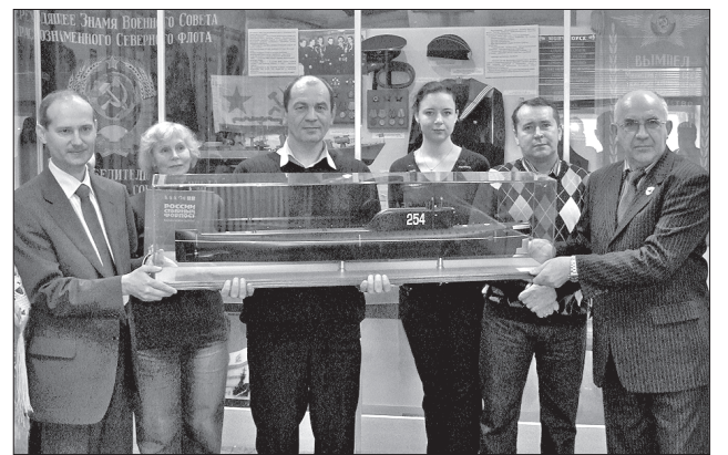
Этот экспонат появился в музее Северного флота