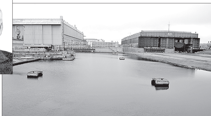
Идеи В.П. Костенко претворились в жизнь на Севмаше

ном доке эллинга. Одновременно решили проблему перемещения кораблей в поперечном направлении (с одной стапельной линии на другую) и организацию мест зимнего хранения в бассейне на верхней ступени. Это была первая серьёзная модернизация стапельно-выводного комплекса, при которой доки утратили свои спусковые функции, а наливной бассейн приобрёл новые – докостройка и хранение кораблей, выведенных на верхний уровень бассейна.