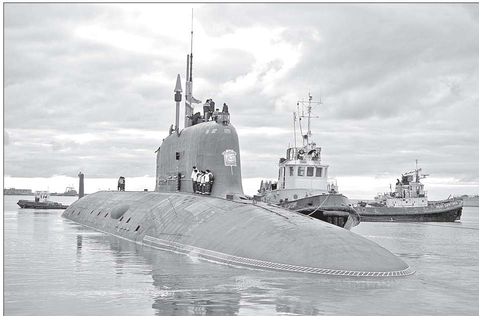
Заводские буксиры обеспечивают ходовые испытания АПЛ «Северодвинск»

Как всегда, суда водно-транспортного цеха 22 Севмаша заняты работой, связанной с выполнением государственного оборонного заказа.